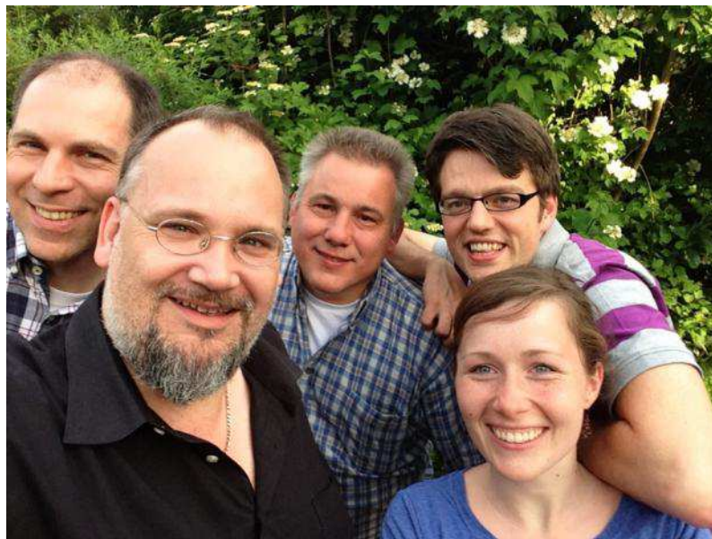
Teil der Coaches Jahrgang 2014-2015